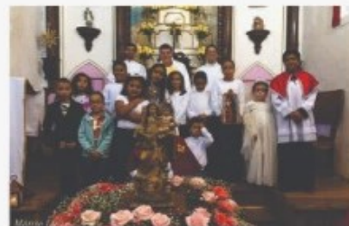
Nossa Senhora das Mercês